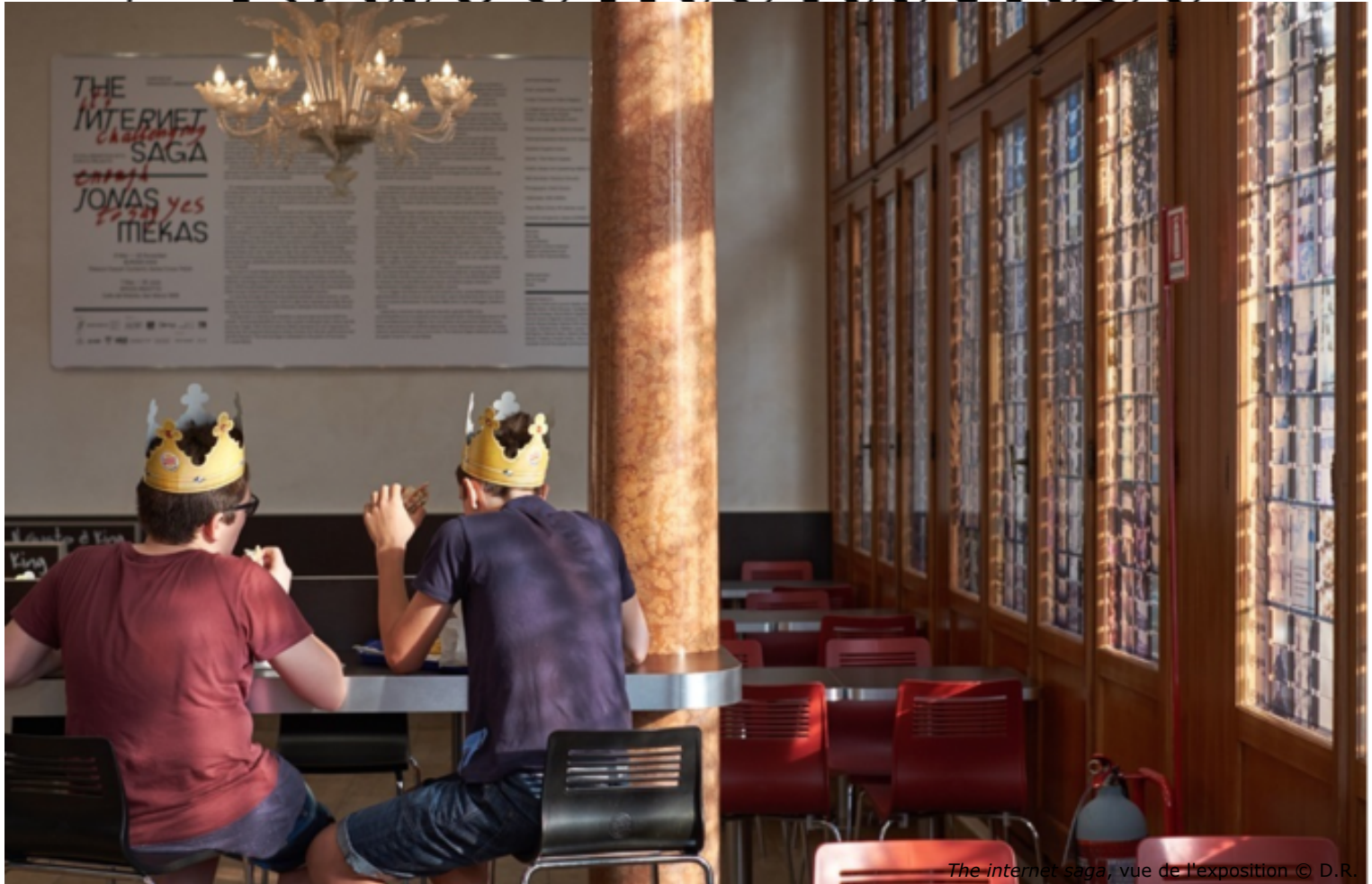
The internet saga, vue de l'exposition

Entretiens arts visuels ( /teteatete/entretiens )